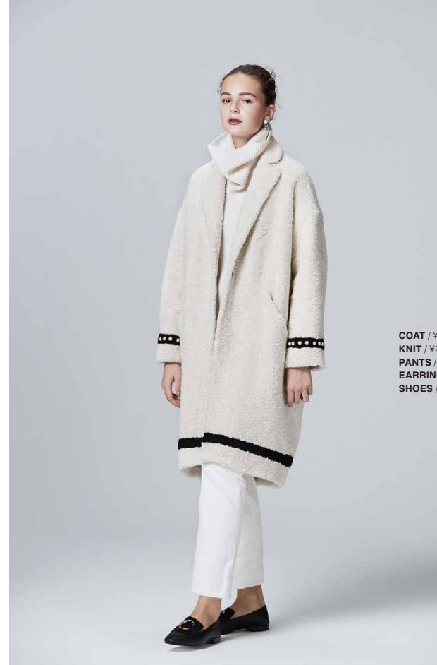
COAT / ¥56,000+Tax : Tu es mon TRÉSOR x PARIGOT KNIT / ¥20,000+Tax : PARIGOT PRESTIGE PANTS / ¥20,000+Tax : YANUK EARRINGS / ¥15,000+Tax : ADER.bijoux SHOES / ¥80,000+Tax : Chloé