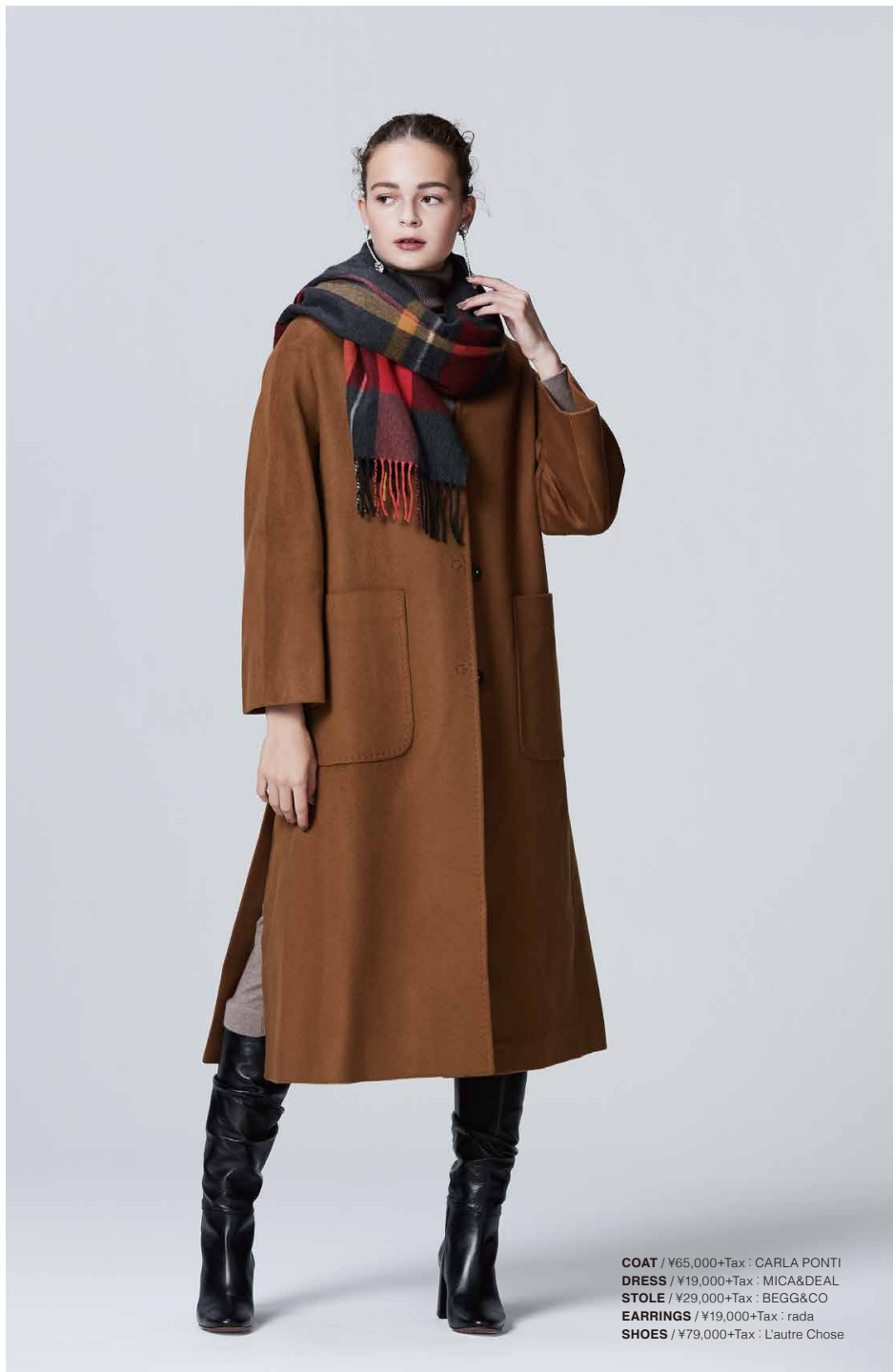
COAT / ¥65,000+Tax : CARLA PONTI DRESS / ¥19,000+Tax : MICA&DEAL STOLE / ¥29,000+Tax : BEGG&CO EARRINGS / ¥19,000+Tax : rada SHOES / ¥79,000+Tax : L'autre Chose