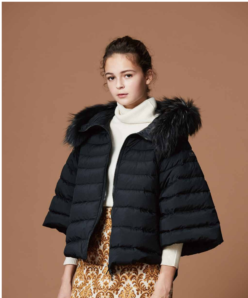
#01 TATRAS PONCHO DOWN JACKET 'MALE'