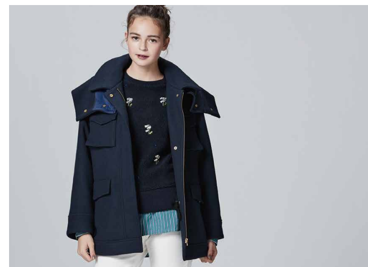
COAT / ¥69,000+Tax : Kaon KNIT / ¥37,000+Tax : MUVEIL