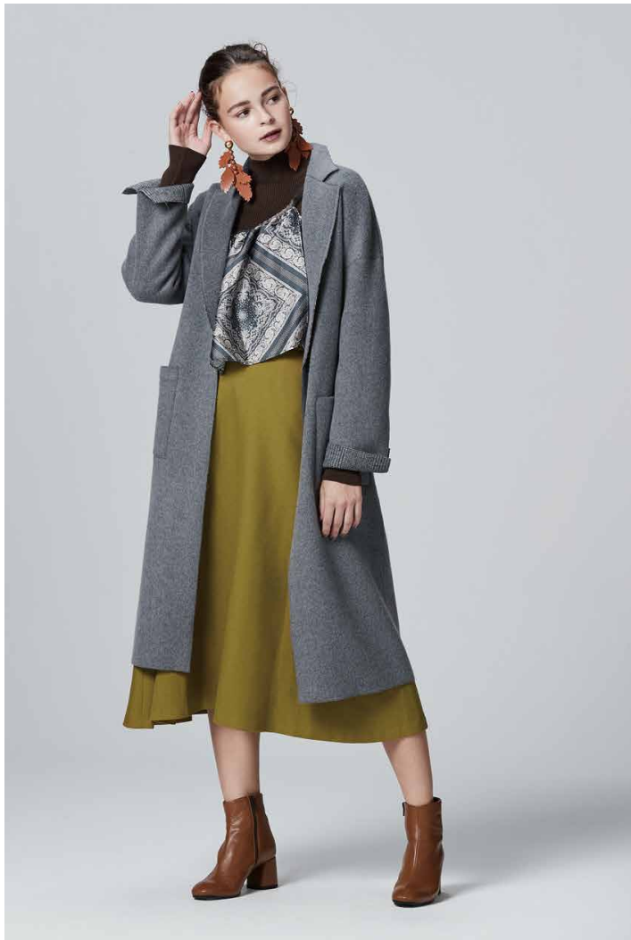
COAT / ¥59,000+Tax : PARIGOT KNIT&BLOUSE / ¥15,700+Tax : AMERI SKIRT / ¥15,000+Tax : PARIGOT EARRINGS / ¥18,000+Tax : THE DALLAS SHOES / ¥38,000+Tax : FABIO RUSCONI