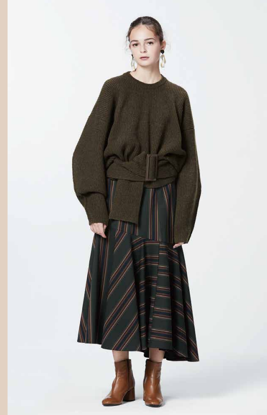
#02 Rito BELTED KNIT

ウエスト部分の切り替えにはラ メ糸を使用したトーションレー スを合わせコンセプトに 表現。首元には、エスニック なジャガードのディテールをデ ザイン。カジュアルにもモード にもフィットする 1 着。