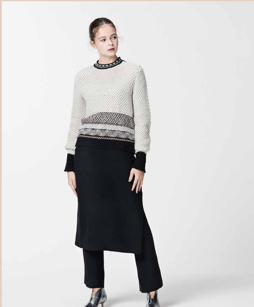
#01 Mame Kurogouchi LAME TWEED KNIT PULLOVER