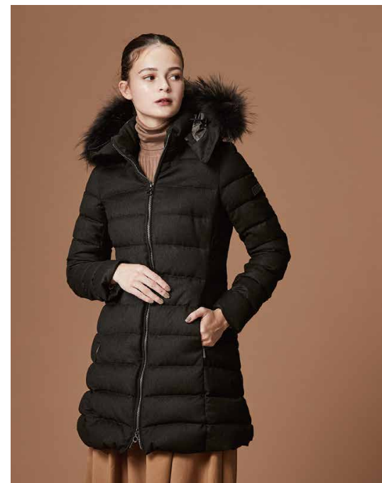
#02 TATRAS DOWN COAT 'LAVIANA'

ワッシャーナイロンと微光沢素材のリバーシブル仕様のダウンポンチョ。身幅とアームホールにゆとりのあるデザインで、インナーに着る服を選ばず、ボトムも合わせやすい。カジュアルが苦手な方にも支持が高いエレガントなアイテム。