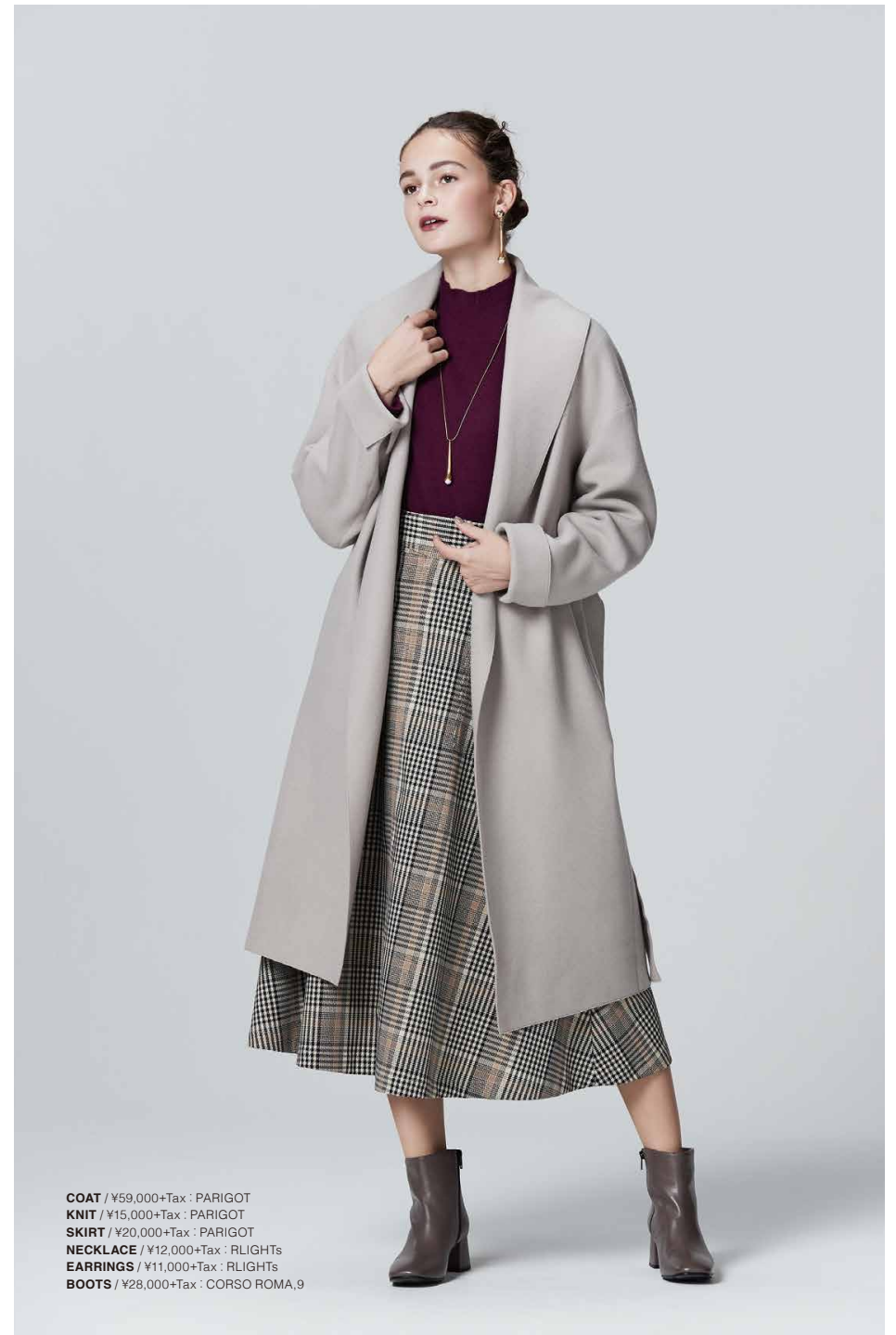
COAT / ¥59,000+Tax : PARIGOT KNIT / ¥15,000+Tax : PARIGOT SKIRT / ¥20,000+Tax : PARIGOT NECKLACE / ¥12,000+Tax : RLIGHTS EARRINGS / ¥11,000+Tax : RLIGHTS BOOTS / ¥28,000+Tax : CORSO ROMA, 9