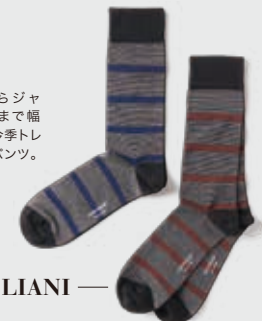
PT01 ¥34,000 カジュアルからジャケットスタイルまで幅広く活躍する、今季トレンドのプリーツパンツ。 MARCOLIANI 各 ¥3,300 ベーシックなボーダー柄が足元のポイントになってくれるソックス。