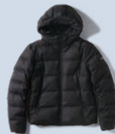
GIACINTO ジャチント ¥110,000

デビュー以来、1番人気の定番型ウールダウン。程よく光沢のある上質なウールファブリックが、カジュアル感をおさえたモデル。撥水加工で通常よりも汚れが付きにくくなっているのもポイント。フードは取り外し可能で機能性も◎。