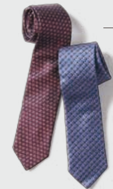
UMBERTO FORNARI 各 ¥9,000 イタリアの古き良き伝統を守り、ハンドメイドで作られた高品質なネクタイ。