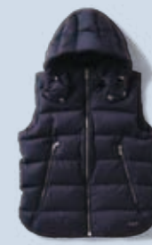
LEONARD レオナルド ¥100,000

デビュー以来、1番人気の定番型ウールダウン。程よく光沢のある上質なウールファブリックが、カジュアル感をおさえたモデル。撥水加工で通常よりも汚れが付きにくくなっているのもポイント。フードは取り外し可能で機能性も◎。