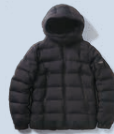
BORBORE ボルボレ ¥92,000

イタリアの最高級生地「ロロ・ピアーナ」を使った、シルク混ウールのダウンベスト。ラグジュアリーな雰囲気が出る、大人のカジュアルスタイルにハマるアウター。