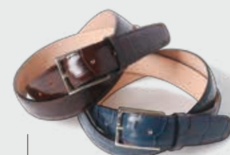
AMBOISE 各 ¥17,000 艶のあるエンボスクロコレザーを使ったベルトは、シューズとも合わせやすいカラーをセレクト。