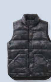
CALICANTO カリカント ¥68,000

マイクロファイバーのドライタッチなストレッチナイロン採用。落ち着きのあつまるマットな質感に仕上げた1着は、身体のラインにフィットする都会的な細身のシルエットが特徴。