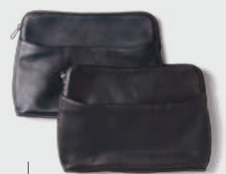
aniary 各 ¥20,000 シュリンクレザーのクラッチバッグは、曲線を多用したデザインで持ちやすさも◎。