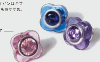
elizabeth parker 各 ¥4,500 クリアな質感と中央のビジュアが大人の遊び心をくすぐるフラワーホールピン。