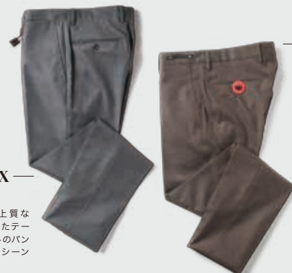
INCOTEX ¥33,500 肌触りの良い上質なウールを使用したテーパーシルエットのパンツは、ビジネスシーンでも使える1本。