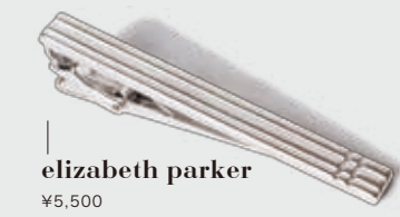
elizabeth parker ¥5,500 上質なシルバーのネクタイピンはギフトとしてもおすすめ。